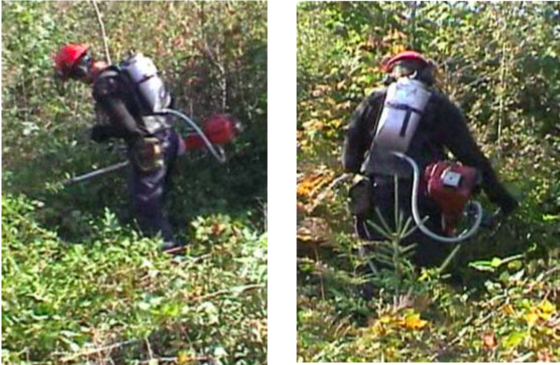
Figure 1: Dispositif Myco-Tech MC vu de côté et de l'arrière.

Toutefois, pour le travailleur, cette méthode n'est pas sans contraintes. Par exemple, lors d'essais réalisés entre août et septembre 2003, le bidon porté par les débroussailleurs et employé pour le badigeonnage, ajoutait un poids supplémentaire de 5 à 7 kg soit un poids total d'équipements de 18 à 22,7 kg incluant le bidon, le dispositif d'épandage, le casque, le harnais et la débroussailleuse. De plus, comme le bidon est la composante la plus lourde de l'équipement ajouté, celui-ci avait pour effet d'élever sensiblement le centre de gravité du travailleur, d'accentuer le déséquilibre du travailleur (Holbein et Chaffin 1997) et de rendre plus difficile la reprise d'un bon appui lors d'un incident. Cette observation suggère donc que le contrôle additionnel de l'équilibre dû au nouveau bidon entraîne une augmentation du coût physiologique pour cette méthode intégrée. Ce constat pourrait être même d'autant plus sévère compte tenu du transport de ce poids additionnel durant toute la journée du travailleur.